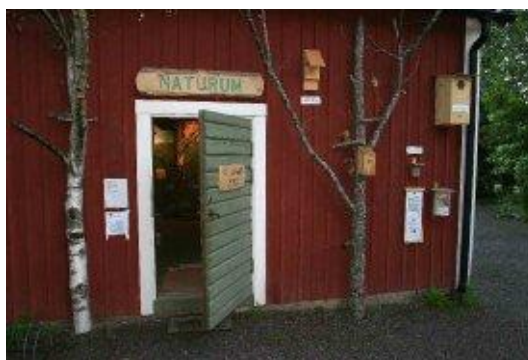
Naturum i Tyresö som under året utvecklades till en obemannad naturskola med hjälp av Nynäshamns Naturskola.