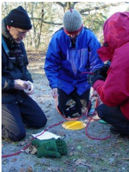
Utematte i Uppsala i november. Deltagarna tillverkar en diametermätare.