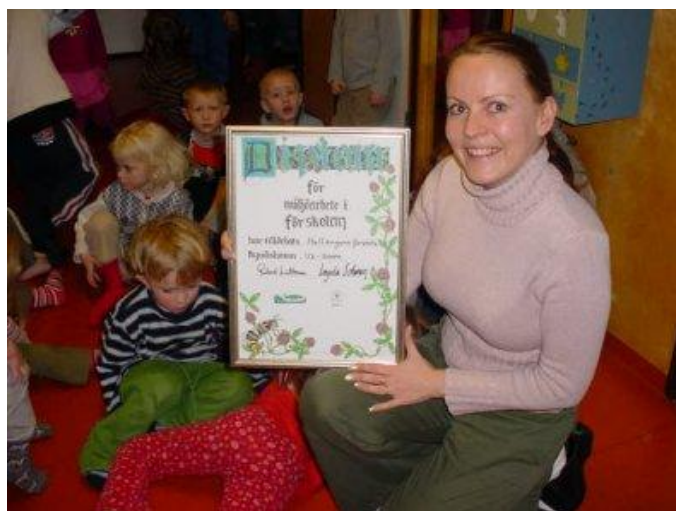
Hallängens förskola mottog silverdiplom för sitt miljöarbete.