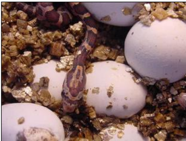
Naturskolans ormar Majsan och Popcorn fick tillökning under sommarlovet.