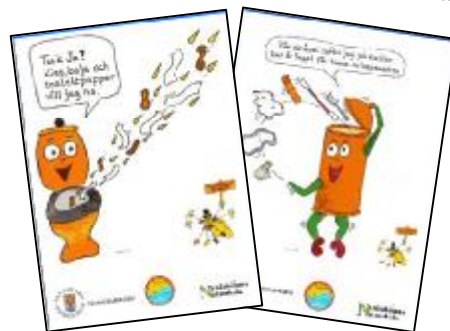
Två kampanjbilder till alla förskolor och lärare i åk f-9.