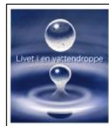
Livet i en vattendroppe, häfte till alla lärare i åk f-9.