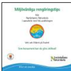
Miljövänliga rengöringstips, folder till alla elever i åk f till 9.