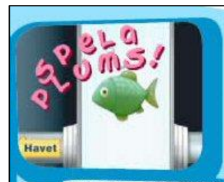
Plums, roligt spel med syfte att lära ut vad som får spolat ner i toaletten. www.gryaab.se