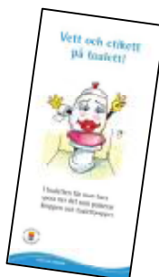
Folder till alla elever i åk f till 9.