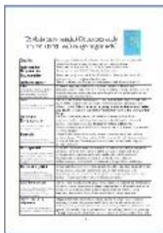
Ordlista med ämnen som är vanliga i tvätt och rengöringsmedel (till alla NO-lärare åk 7-9).