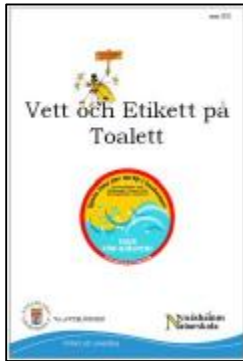
Handledning till alla lärare och förskolor (fsk, åk f-3, 4-6, 7-9)