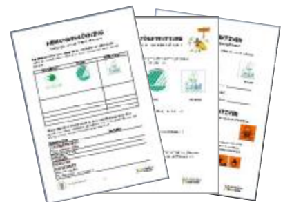
Protokoll för elevernas hemundersökningar. (åk f-3, 4-6, 7-9)