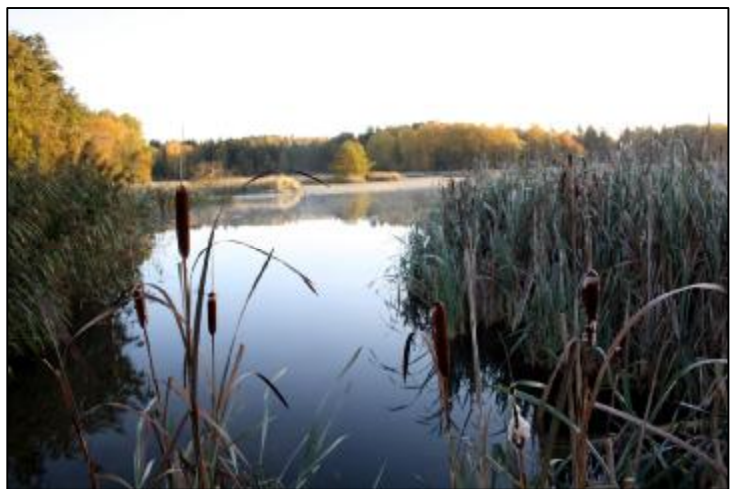
Våtmark Alhagen i oktober.

Avloppet från Sorunda, Grödbby och Ristomta hamnar i Torps reningsverk och slutligen i Fitunaån. Avloppsvatten från St Vika hamnar i Marstas reningsverk och slutligen i Fällnäs-viken. Avlopp från hushåll som har slamtömning hamnar med hjälp av slambilen i Nynäshamns reningsverk och sedan i Alhagen.