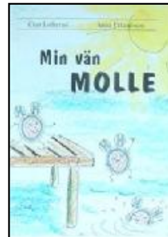
Min vän Molle, bok till alla lärare åk 1.