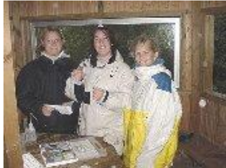
Årskurs 9 gjorde kemiska mätningar