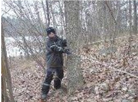
Årskurs 2 använde sina sinnen